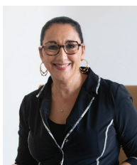
Fadila KHATTABI Ministre déléguée chargée des Personnes handicapées

La politique publique de lutte contre les maltraitances envers les adultes en situation de vulnérabilité est l'héritière de l'expérience des politiques de lutte contre les violences faites aux femmes et aux enfants. Elle requiert les mêmes prises de conscience, les mêmes engagements et les mêmes exigences. Recevant les fruits des travaux déjà menés dans le cadre du Grenelle des violences conjugales, de la CIASE, de la CIIVISE, nous voulons constituer une dynamique collective : la lutte contre les maltraitances envers les adultes emprunte à ces combats antérieurs et revitalise cette recherche d'une société sûre pour toutes les personnes vulnérables et fragiles.