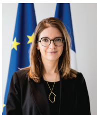
Aurore BERGÉ Ministre des Solidarités et des Familles

De mars à juillet 2023, les États généraux des maltraitances ont ouvert une question particulièrement sensible : celle des violences ou négligences que subissent les adultes en situation de vulnérabilité, en particulier les personnes avancées en âge, les adultes en situation de handicap ou de précarité. L'objectif était clair : ne pas mettre la poussière sous le tapis et affronter collectivement cette question de société.